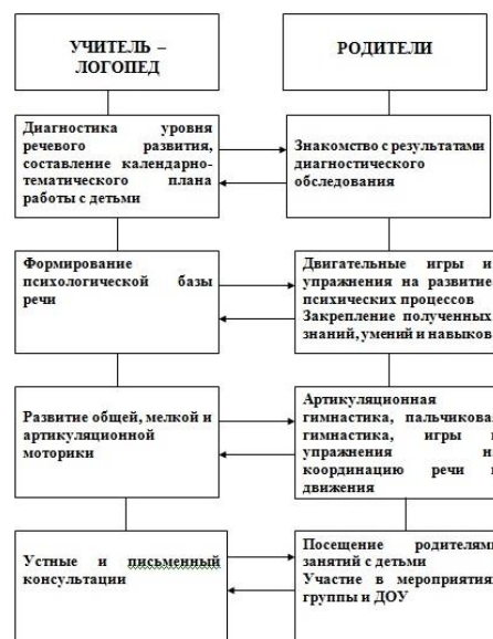
МОДЕЛЬ ВЗАИМОДЕЙСТВИЯ УЧИТЕЛЯ-ЛОГОПЕДА С РОДИТЕЛЯМИ

Без постоянного и тесного взаимодействия с семьями обучающихся коррекционная логопедическая работа будет не полной и недостаточно эффективной. Поэтому интеграция школы и семьи – одно из основных условий работы учителя-логопеда в условиях логопедического пункта. Модель взаимодействия с семьями детей, имеющими нарушения речи, представлена в схеме.